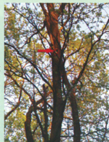
Zajęta przez szpaki dziupla w dębie rosnącym w sąsiedztwie stacji Podkowa Leśna Zachodnia