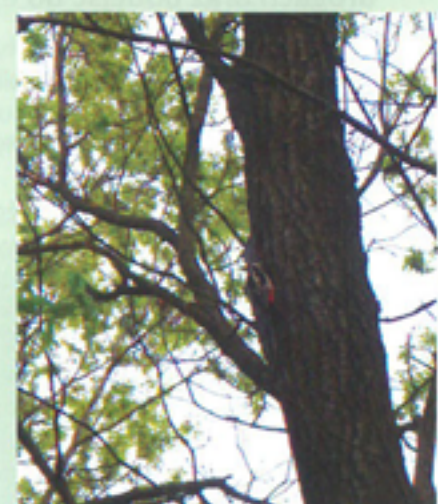
Karmiący młode dzięcioł duży przy dziupli w dębie rosnącym w sąsiedztwie stacji Podkowa Leśna Zachodnia