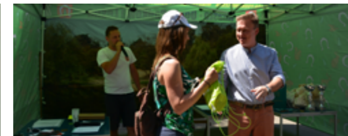
Uczestniczka rajdu odbierająca upominek na mecie