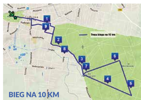
BIEG NA 10 KM