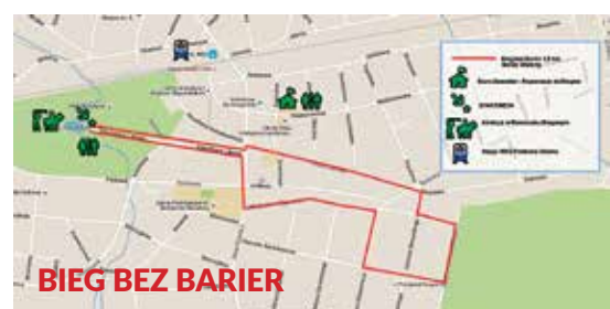
BIEG BEZ BARRIER

➤ Impreza organizowana w ramach VIII Europejskiego Tygodnia Sportu dla Wszystkich, XXII Sportowego Turnieju Miast i Gmin 2016