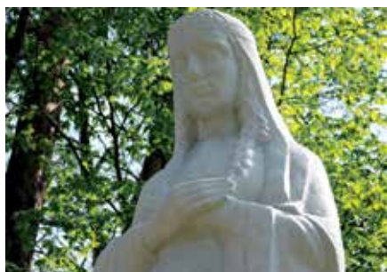
Figura Matki Boskiej odrestaurowana

7 kwietnia b.r. u zbiegu ulic Parkowej i Bluszczowej zabiegom konserwacyjnym poddana została figura Matki Boskiej. Prace przede wszystkim polegały na truci i usunięciu warstw mikroorganizmów, myciu warstw brudu oraz zabezpieczeniu rzeźby przed działaniem warunków atmosferycznych.