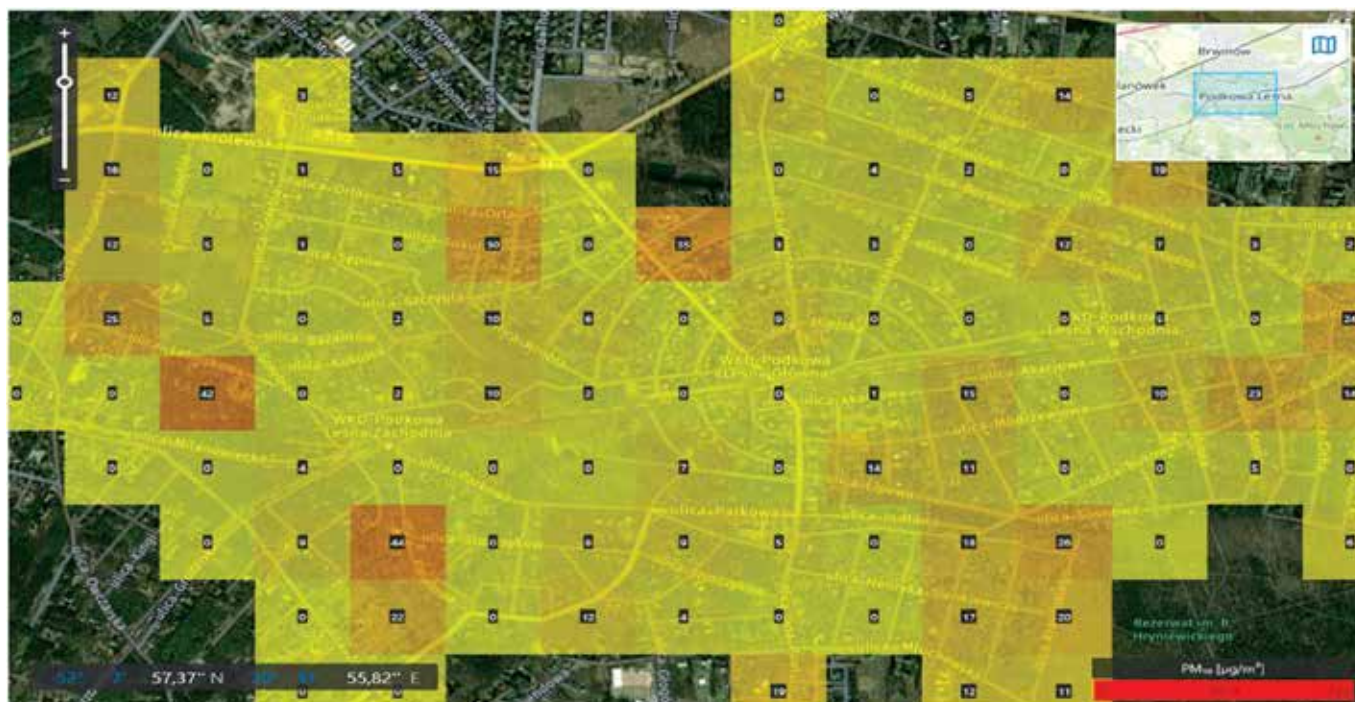
Rysunek nr 1 – Pomiar stężenia pyłów PM 10 – pomiar z drona dnia 2.03.2022

na występowanie punktowych zagrożeń wykazanych przy pomiarach PM 10, zarówno przy badaniach z powietrza jak i z ziemi (rys nr 1 i 2) oraz zwiększonego stężenia PM 2,5 w pomiarach z ziemi (rys nr 3).