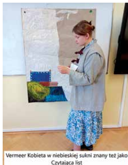
Vermeer Kobieta w niebieskiej sukni znany też jako Czytająca list

W ramach lekcji języka polskiego Uczniowie poznali siedem obrazów i siedem korespondujących z nimi tekstów poetyckich. Przybliżane wiersze były też przyczynkiem do rozmów na temat relacji międzyludzkich, uczuć, upływu czasu i roli sztuki. Największym wyzwaniem dla ósmoklasistów były żywe obrazy. Pod kierunkiem tego wspaniałego nauczyciela poradzili sobie znakomicie.