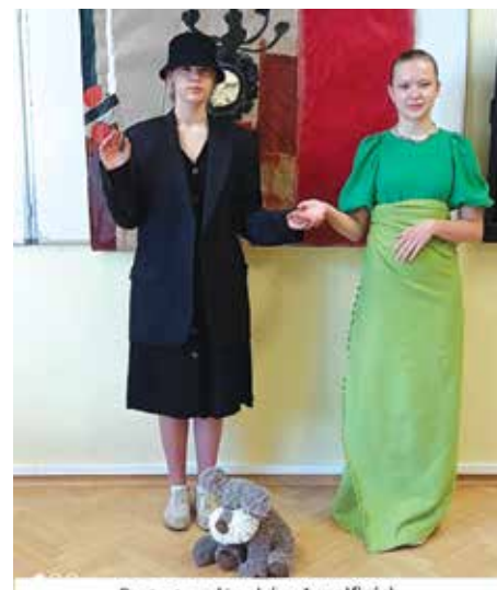
Portret małżonków Arnolfinich