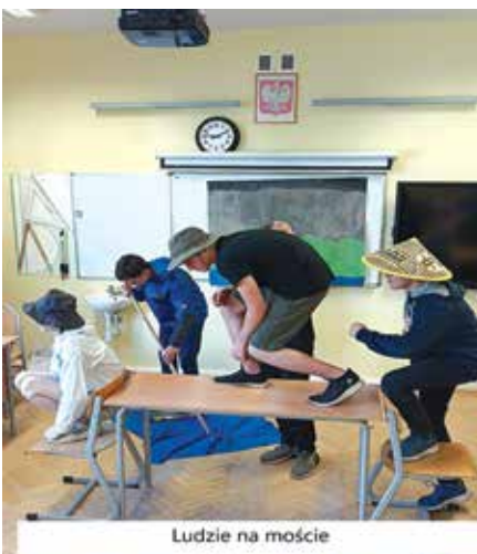
Ludzie na moście